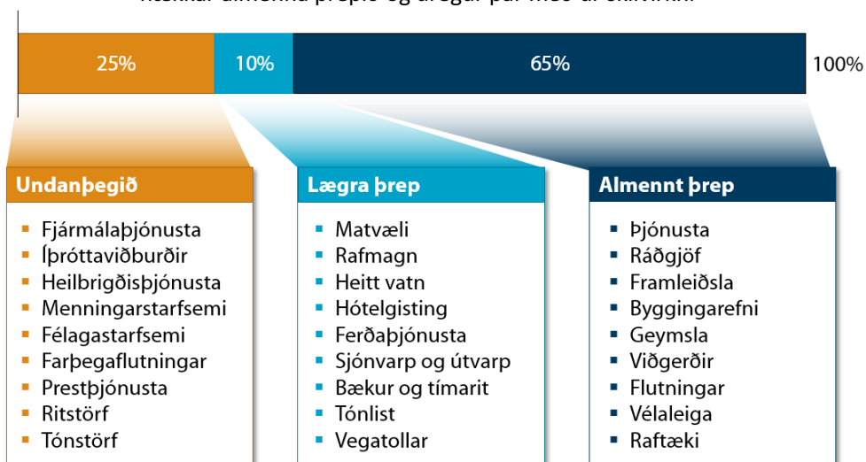
Mynd 1: Mikið umfang undanþága og starfsemi í lægra þrepi virðisaukaskatts hækkar almenna þrepið og dregur þar með úr skilvirkni

Þjóðhagslegt mikilvægi íþróttahreyfingarinnar er óumdeilt og færa má rök fyrir því að hið opinbera eigi að styðja við hana með einhverjum hætti. Viðskiptaráð er þó almennt mótfallið auknum undanþágum frá greiðslu virðisaukaskatts. Íslenska virðisaukaskattkerfið er óskilvirkt og innheimtuhlutfall héraendis er vel undir meðaltali OECD ríkja. 2 Það orsakast af miklu umfangi undanþága og því að margir veigamiklir vöru- og þjónustuflokkar falla undir lægra skattþrep, sem veldur því að hið almenna þrep skattsins hækkar (mynd 1).